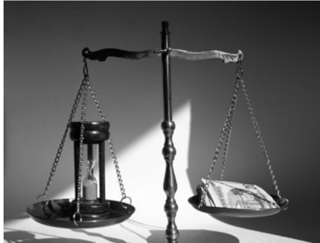
Determinar a liquidez de um ativo depende do período em consideração

É quanto a isso que a idéia de liquidez nas finanças empresariais difere da idéia de liquidez pessoal - para as obrigações financeiras de um indivíduo, um ano é prazo relativamente longo, mas isso não procede para uma empresa. No entanto, a idéia de liquidez se torna ainda mais complicada no mundo empresarial. Determinar se um ativo é líquido depende da data de vencimento das obrigações. O período que torna um ativo corrente, por exemplo, pode ser um ano ou a duração do ciclo operacional da empresa. Por outro lado, a disposição da empresa de vender ativos antecipadamente (o que a força a aceitar preço mais baixo) também influencia a classificação de liquidez que eles recebem.